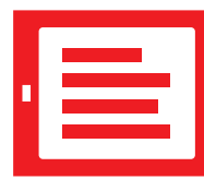
Tablette / Notebook